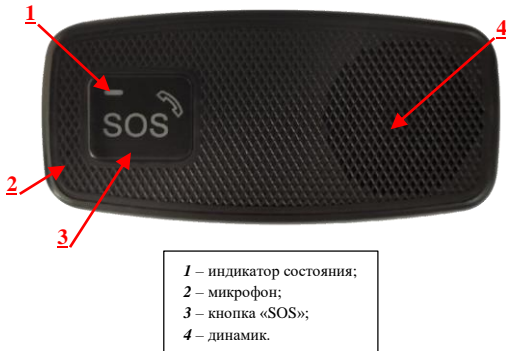
Рисунок 1 - Внешний вид изделия сверху